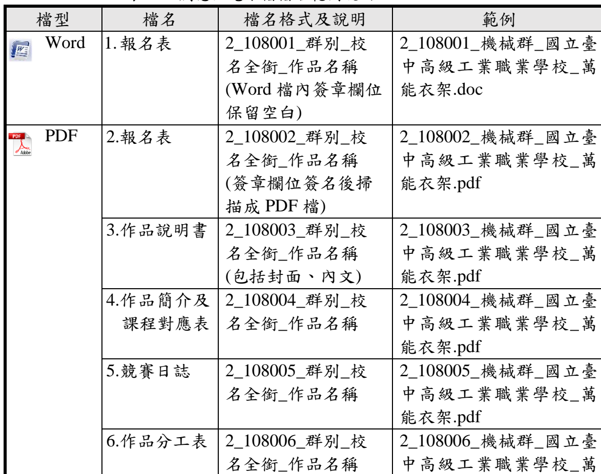
表 1-4 創意組電子檔檔名範例說明