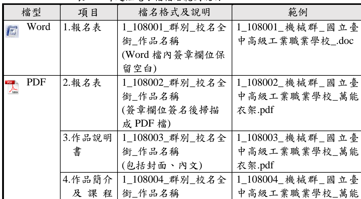
表 1-2 專題組電子檔檔名範例說明