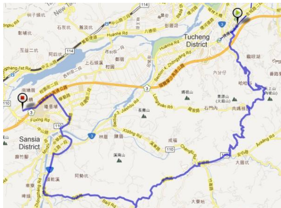
■ 活動路線圖_全長約 25.3KM

→左轉千歲路→忠承路→忠義路→左轉承天路→左轉南天母路→桐花公園→直行至底右轉成福路(110 縣道)→315 巷左轉成福橋→右轉竹崙路接紫微路→白雞紫微路口右轉下切→白雞路右轉→直行正義街→直行進中正路一段(臺三線)→右轉大同路→直行長泰街→右轉介壽路一段(110 縣道)上三峽大橋→過橋右轉民生街直行三樹路→左轉大學路→左轉隆恩街過隧道→新北市客家文化園區。(本園區特別安排自行車停車場及管理人員，屆時騎士們可將車輛置放於該停車場，並參與園區後續之活動)。